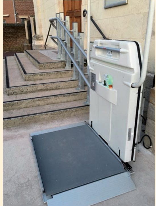
Plateforme en mode déplié prête à être utilisée

Boitiers de commande: Un en partie basse l'autre en partie haute des escaliers