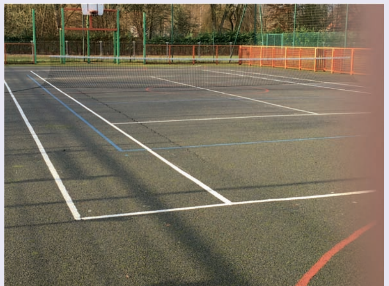
Le terrain de tennis