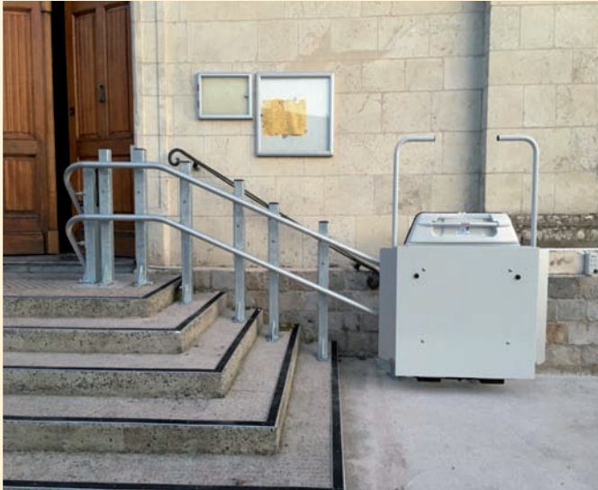
Plateforme en mode replié

Boutons d'appel pour faire monter ou descendre la plateforme