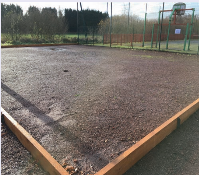
Le terrain de pétanque