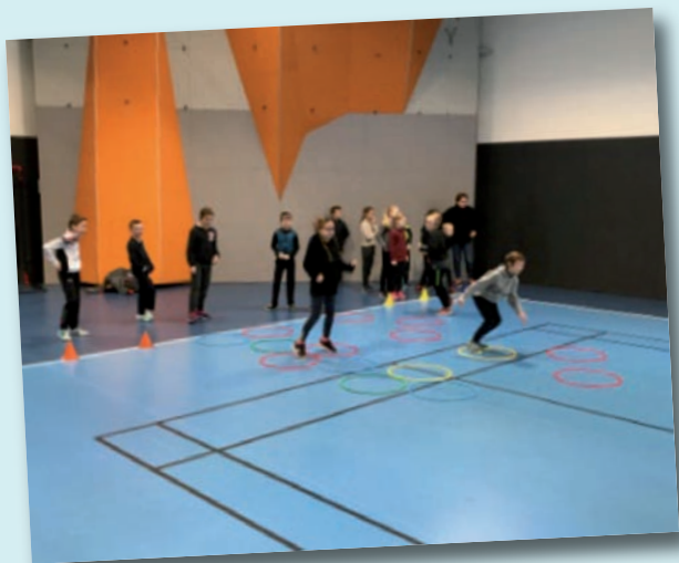
Activité athlétisme avec les enfants de l'école primaire proposée par l'Education Nationale