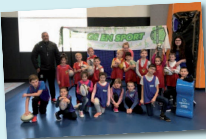
Atelier d'initiation au rugby durant l'accueil de loisirs municipal pendant les vacances d'hiver

Les jeunes de notre village ont pris possession de cet équipement, en effet l'éducateur sportif de la commune les accueille tout au long de la semaine dans le cadre de la pause méridienne, de la garderie et des accueils de loisirs municipaux. Ils ont la possibilité de découvrir différentes activités physiques et sportives telles que le football, le rugby, le volley-ball, le tir à l'arc, le badminton, le tennis de table.