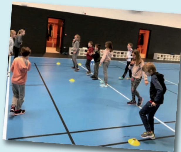
Ateliers « jeux collectifs de coopération » avec les enfants de l'école primaire durant la pause méridienne