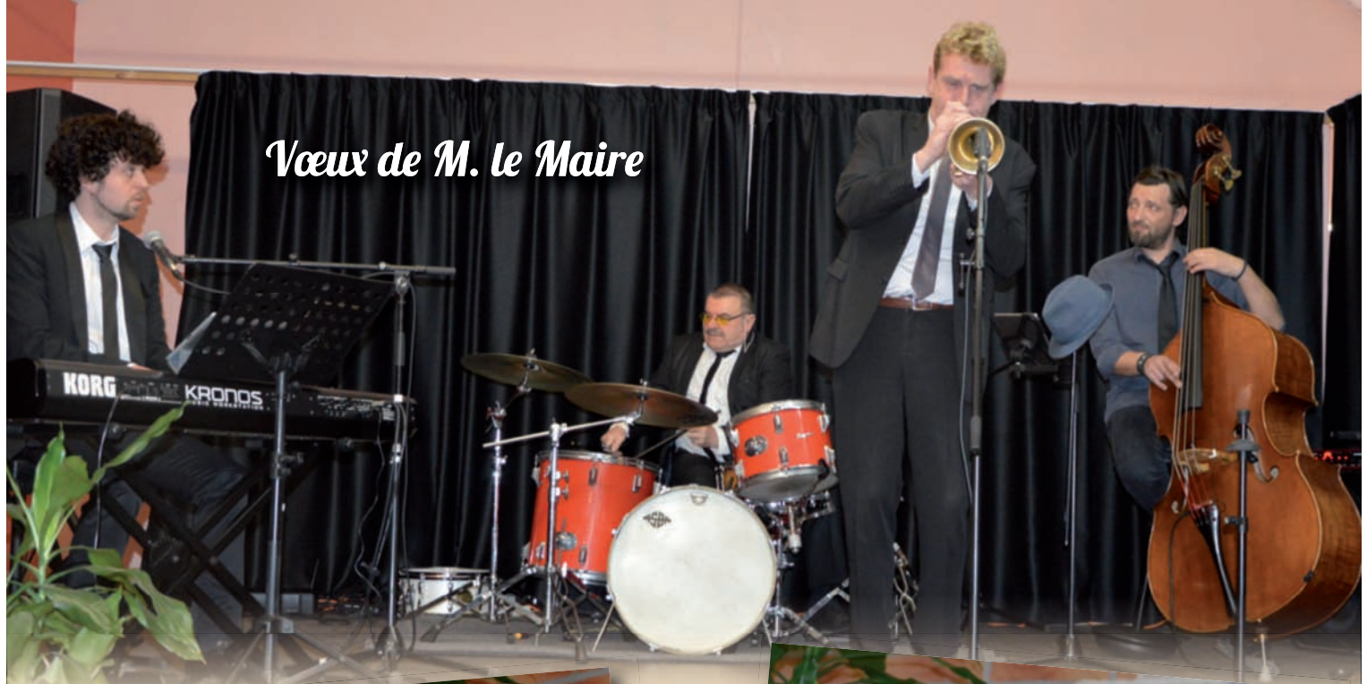
Vœux de M. le Maire